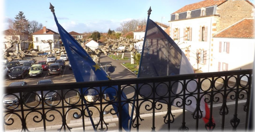
Mairie de Grenade-sur-l'Adour - Vue du balcon